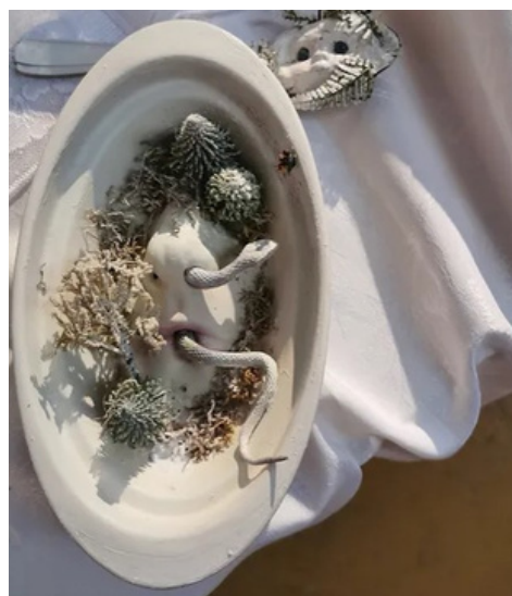
PLAT À GRATIN DE VIPÈRE