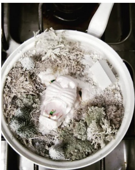
POÊLE GUEULE DE LOUP