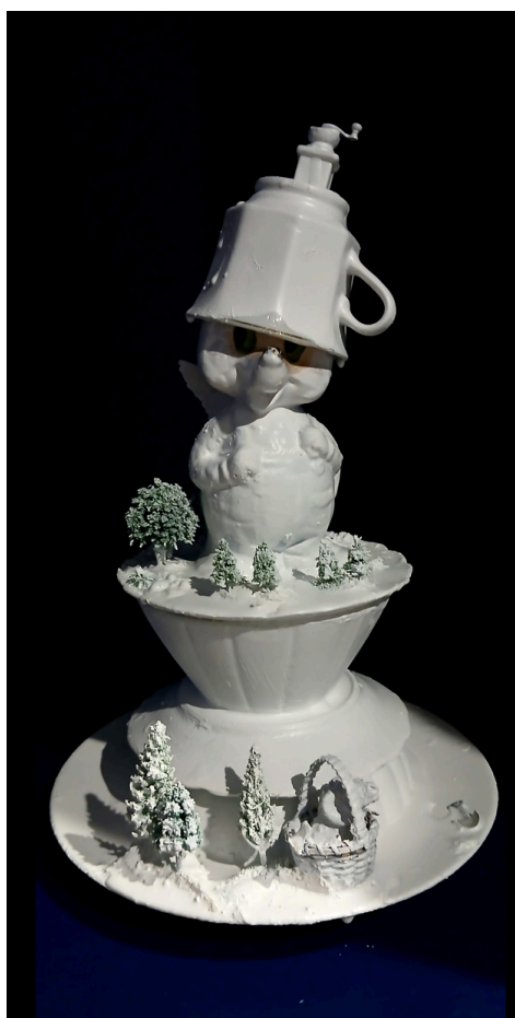
LOUP SOUS TASSE À CAFÉ

composition , vaisselle, porcelaine, figurines... ø 26 cm 35 cm de hauteur