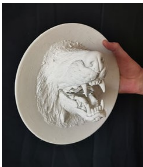
ASSIETTE GUEULE DE LOUP