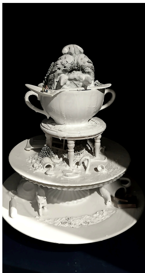
PRÉSENTOIR À GÂTEAUX GUEULE DE LOUP

porcelaine, bougeoir, figurines résine ø 14 cm et 30 cm de hauteur